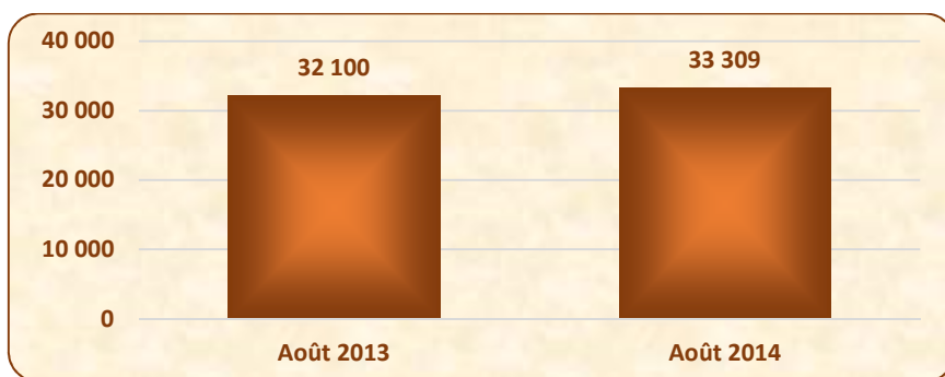
➤ Nombre de créations d'entreprises en août 2013 et août 2014

❖ Les quatre mois qui viennent de s'écouler ont vu une sensible hausse du nombre de nouvelles entreprises (+ 2 % au regard des quatre mois équivalents de l'année précédente). Cette évolution se place dans la continuité du début de l'année qui enregistrerait une hausse équivalente (+ 2 % entre la période janvier-avril 2013 et la période janvier-avril 2014).